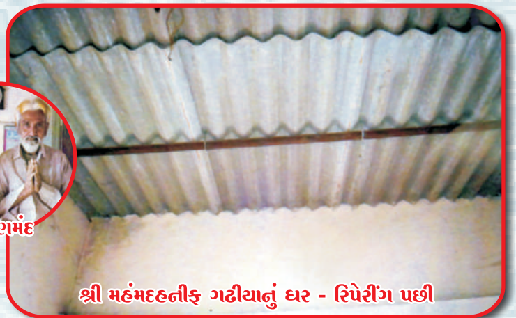
શ્રી મહંમદહનીફ ગઢીયાનું ઘર - રિપેરીંગ પછી