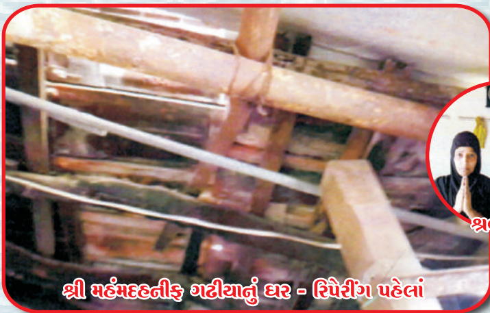
શ્રી મહંમદહનીફ ગઢીયાનું ઘર - રિપેરીંગ પહેલાં