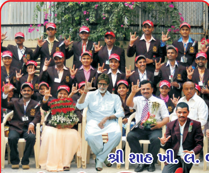
શ્રી શાહ ખી. લ. બહેરાં-મુંગા શાળાનો