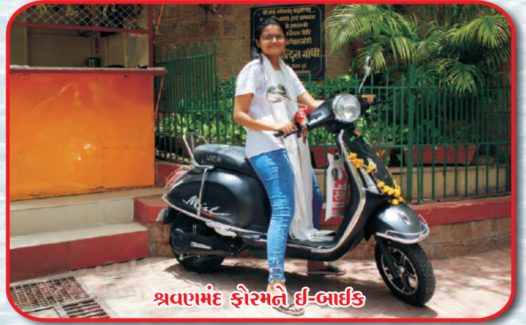
શ્રવણમંદ ફોરમને ઇ-બાઈક