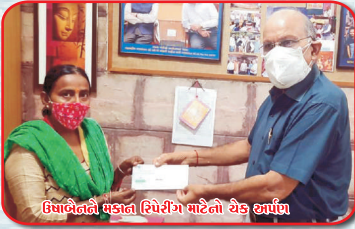
ઉધાબૈનને મકાન રિપેરીંગ માટેનો ચેક અર્પણ