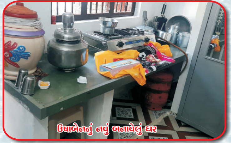
ઉધાબૈનનું નવું બનાવેલું ઘર