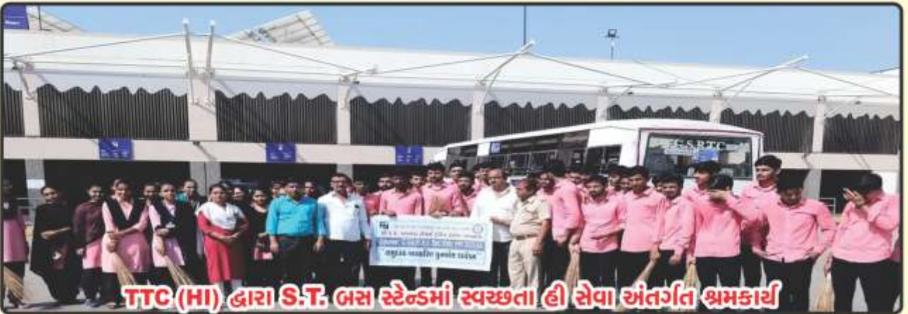
TTC (HI) દ્વારા S.T. બસ સ્ટેન્ડમાં સ્વચ્છતા હી સેવા અંતર્ગત શ્રમકાર્ય