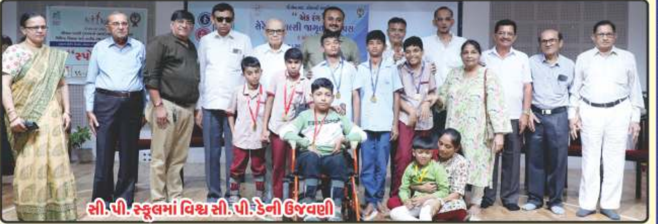
સી. પી. સ્કૂલમાં વિશ્વ સી. પી. ડેની ઉજવણી