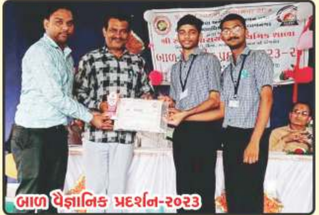
બાળ વૈજ્ઞાનિક પ્રદર્શન-૨૦૨૩