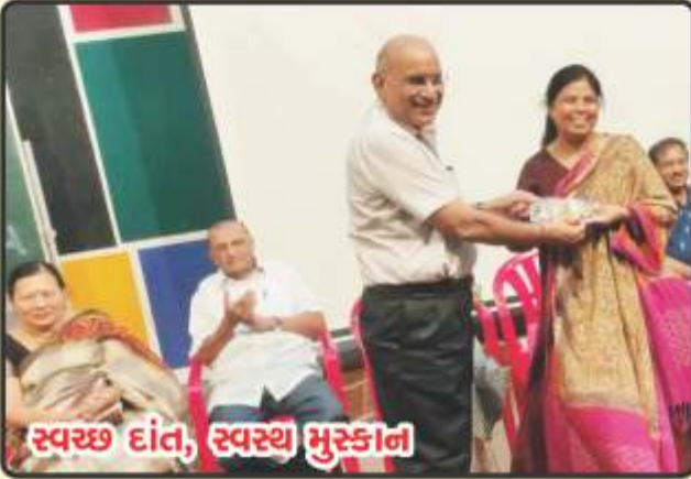
સ્વચ્છ દાંત, સ્વસ્થ મુસ્કાન