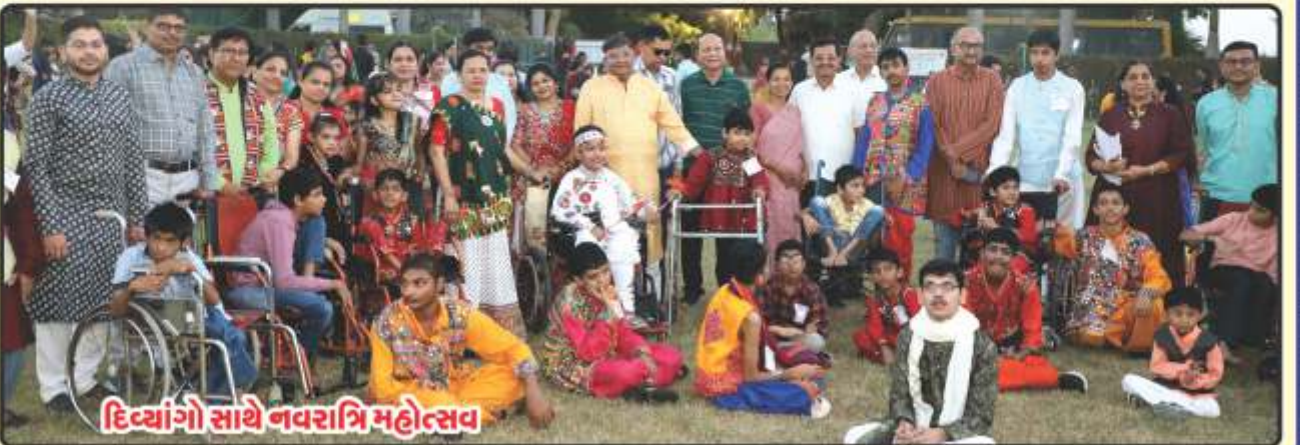
દિવ્યાંગો સાથે નવરાત્રિ મહોત્સવ