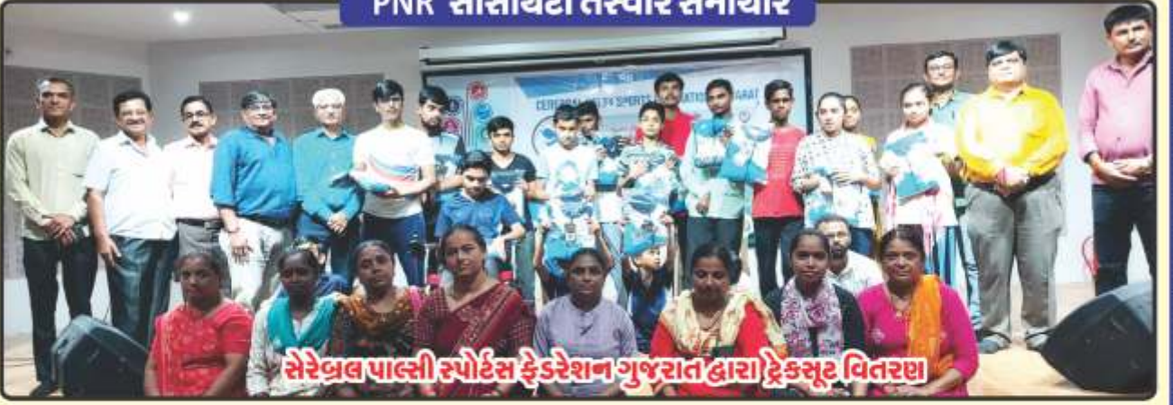
સેરેબ્રલ પાલ્સી સ્પોર્ટ્સ ફેડરેશન ગુજરાત દ્વારા ટ્રેકસૂટ વિતરણ