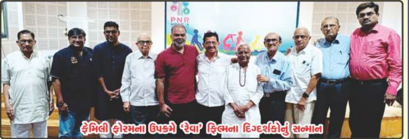
ફેમિલી ફોરમના ઉપક્રમે 'રેવા' ફિલ્મના દિગ્દર્શકોનું સન્માન