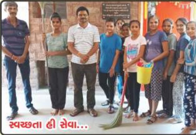
સ્વચ્છતા હી સેવા...