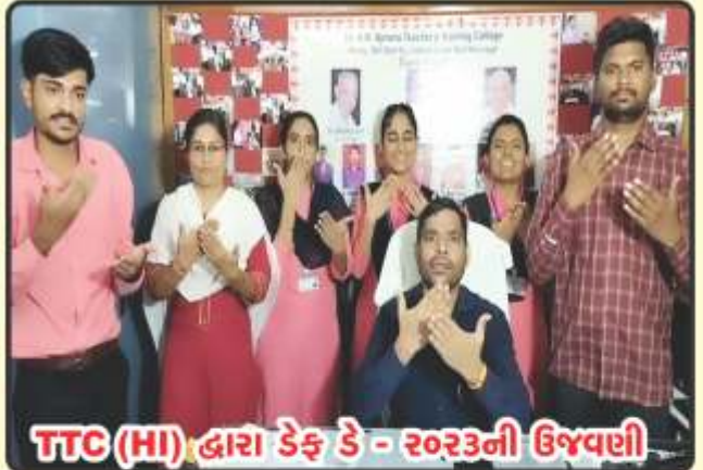
TTC (HI) દ્વારા ડેફે ડે - ૨૦૨૩ની ઉજવણી