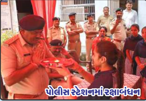
પોલીસ સ્ટેશનમાં રક્ષાબંધન