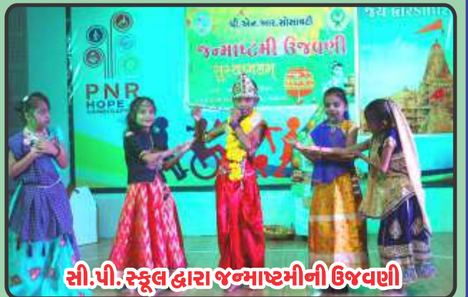
સી.પી. સ્કૂલ દ્વારા જન્માષ્ટમીની ઉજવણી