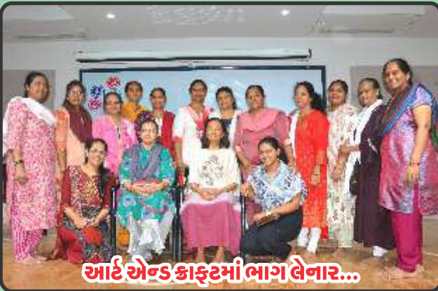
આઈ એન્ડ કાફરમાં ભાગ લેનાર...