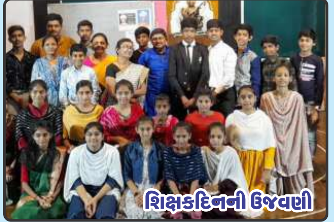
શિક્ષક દિનની ઉજવણી