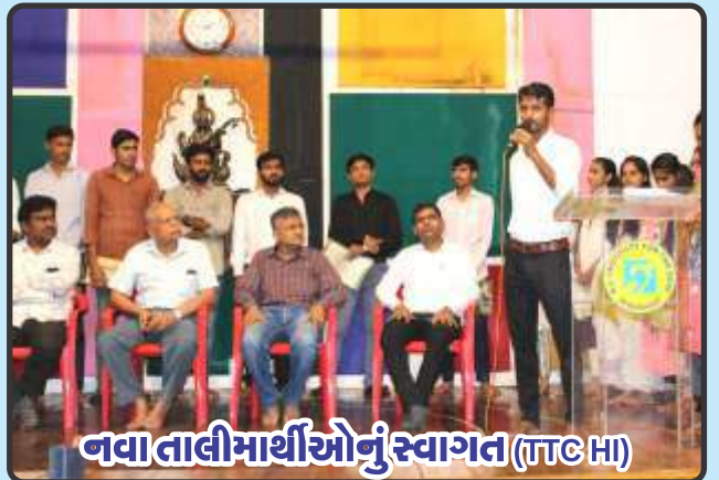
નવા તાલીમાર્થીઓનું સ્વાગત (TTC HI)