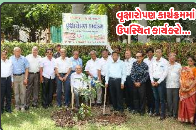
વૃક્ષારોપણ કાર્યક્રમમાં ઉપસ્થિત કાર્યકરો...