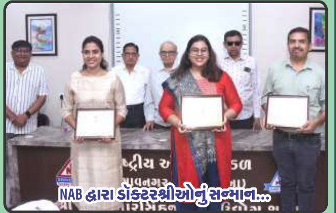
NAB દ્વારા ડૉક્ટરશ્રીઓનું સન્માન...