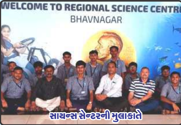
સાયન્સ સેન્ટરની મુલાકાતે