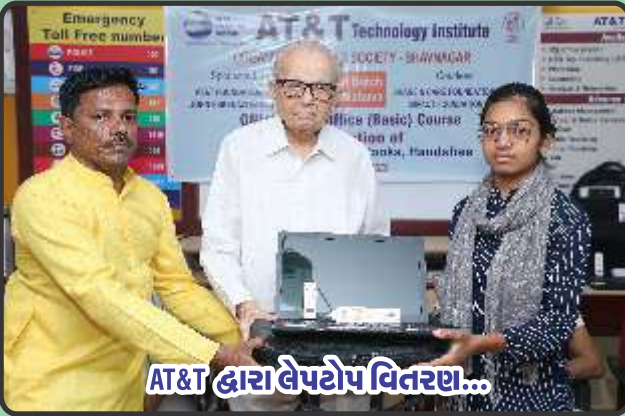
AT&T દ્વારા લેપટોપ વિતરણ...