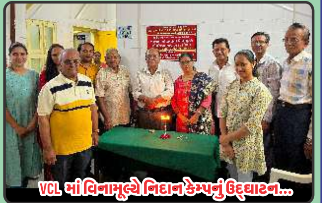
VCL માં વિનામૂલ્યે નિદાન કેમ્પનું ઉદ્ઘાટન...