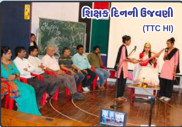
શિક્ષક દિનની ઉજવણી (TTC HI)