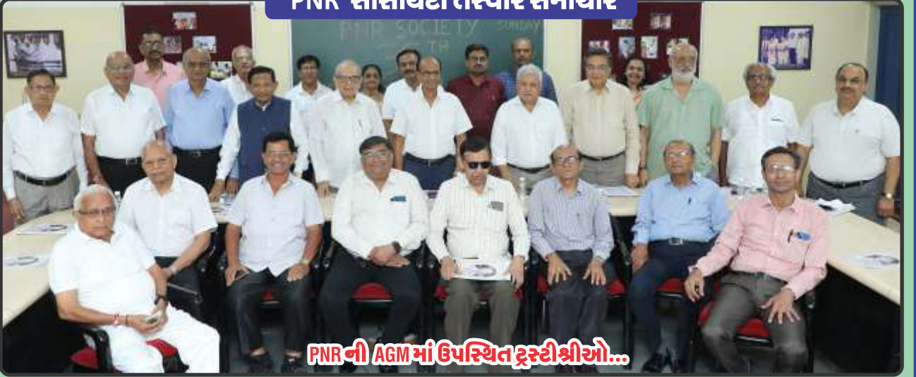
PNR ની AGM માં ઉપસ્થિત ટ્રસ્ટીશ્રીઓ...