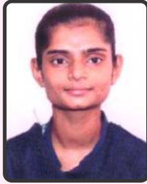
રાઠોડ નાજિયા 63%