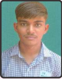
સોલંકી વિશાલ 64.4%