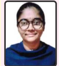
રાજયગુરૂ કિંજલ 50%