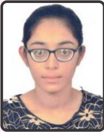
ગોદવાણી સોનાલી 64%