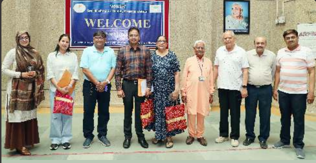
અંકુર સંસ્થાની મુલાકાતે કલેક્ટરશ્રી...