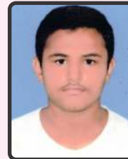
ધારૂકટા જેનિલ 50%