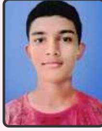
બલર કૃષ્ણાલ 74.2%