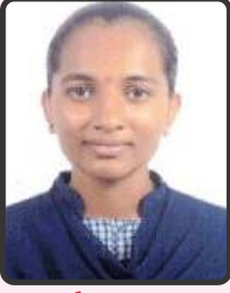
બારૈયા હિરલ 77.7%