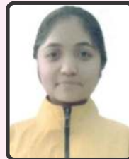
માળી ભાવના 51%