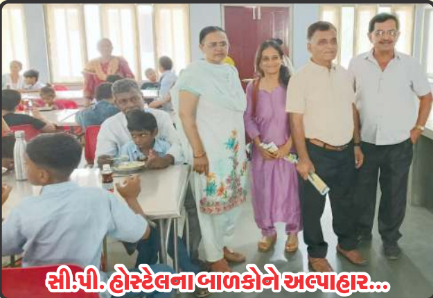
સી.પી. હોસ્ટેલના બાળકોને અલ્પાહાર...