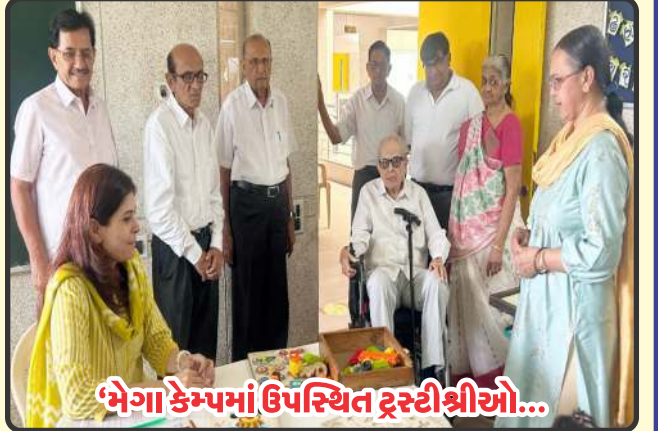
‘મેગા કેમ્પમાં ઉપસ્થિત ટ્રસ્ટીશ્રીઓ...