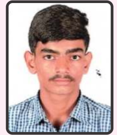
ગાહા નિખામ 54%