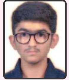
આરદેશણા પ્રિત 59.8%