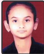
ગોહિલ પ્રિન્સીબા 51%