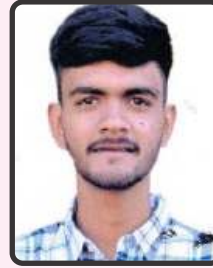
રાઠોડ ઈન્દ્રજીત 60.4%