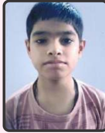
નિર્મળ હિત 60.6%