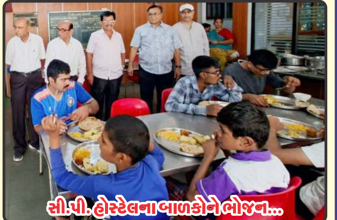
સી.પી. હોસ્ટેલના બાળકોને ભોજન...