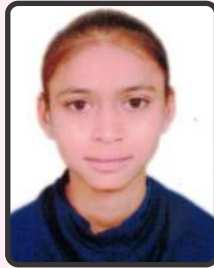
પઠાણ તરાના 60%