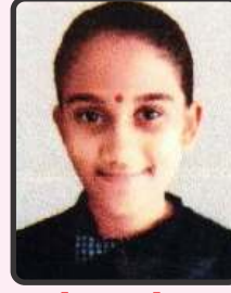
પટોલીયા ફેન્સી 71.2%