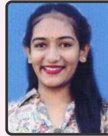
લક્કડ તનુશ્રી 55%