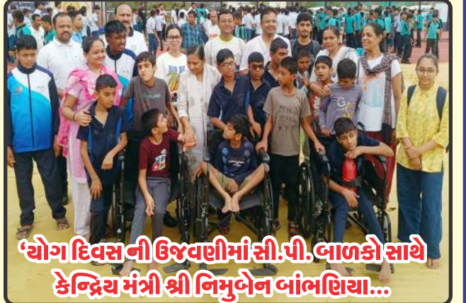
‘યોગ દિવસ ની ઉજવણીમાં સી.પી. બાળકો સાથે કેન્દ્રીય મંત્રી શ્રી નિમુબેન બાંભણિયા...