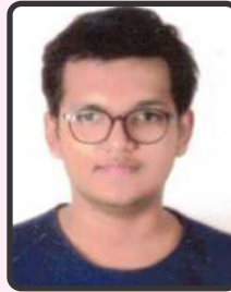
ચોટલિયા જય 59%