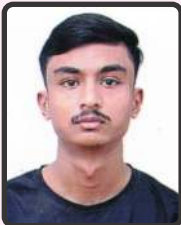
ગોંડલિયા સાગર 52%