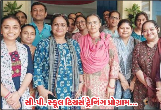
સી.પી. સ્કૂલ ટિચર્સ ટ્રેનિંગ પ્રોગ્રામ...