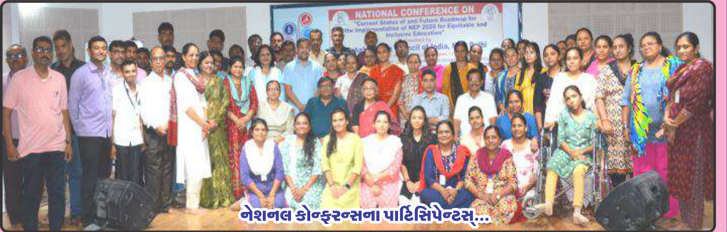
નેશનલ કોન્ફરન્સના પાર્ટિસિપેન્ટ્સ...