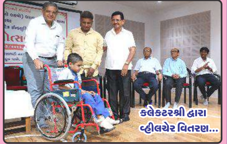
કલેક્ટરશ્રી દ્વારા વ્હીલચેર વિતરણ...