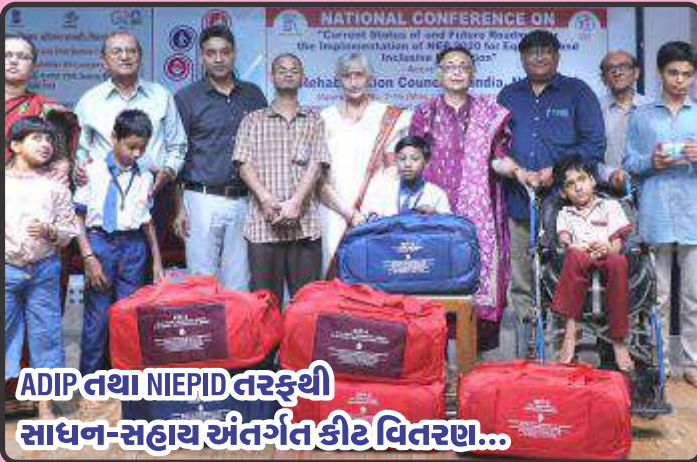
ADIP તથા NIEPID તરફથી સાધન-સહાય અંતર્ગત કીટ વિતરણ...