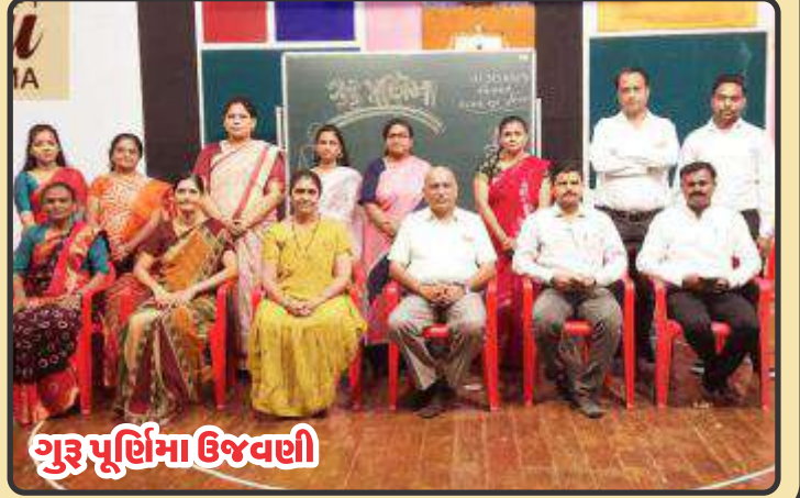
ગુરુ પૂર્ણિમા ઉજવણી