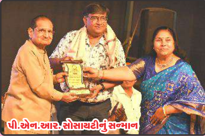
પી.એન.આર. સોસાયટીનું સન્માન