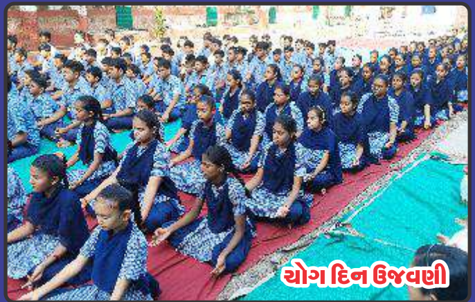
યોગ દિન ઉજવણી