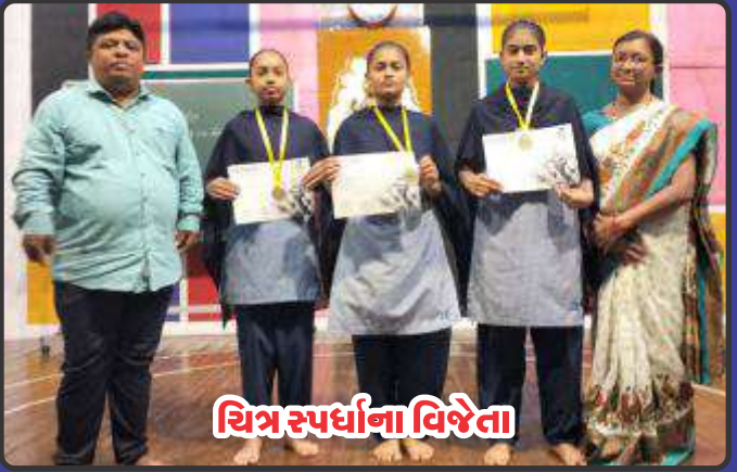
ચિત્ર સ્પર્ધાના વિજેતા