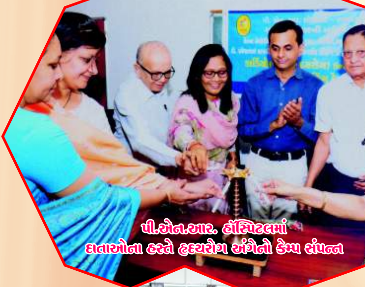
પી.એન.આર. હોસ્પિટલમાં ઘાતાચોના હસ્તે હૃદયવેગ અંગેનો કેમ્પ સંપન્ન