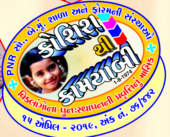
૧૫ એપ્રિલ - ૨૦૧૯, અંક નં. ૭૬/૪૪૨