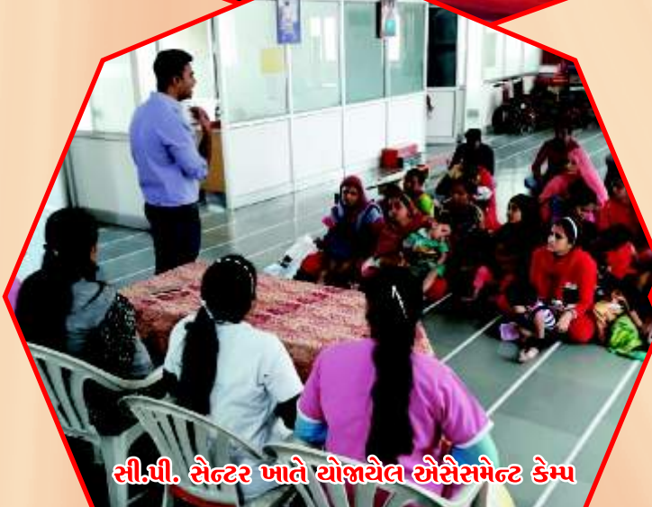
સી.પી. સેન્ટર ખાતે યોજાયેલ ઍસેસમેન્ટ કેમ્પ